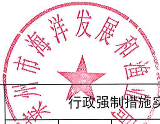
3. 莱州市海洋发展和渔业局2021年度行政强制情况统计表