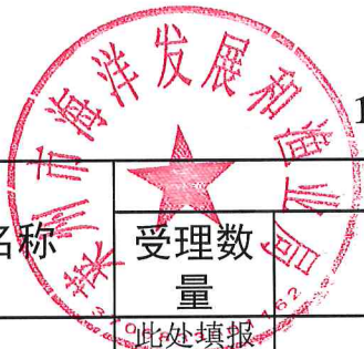
1. 莱州市海洋发展和渔业局2021年度行政许可情况统计表