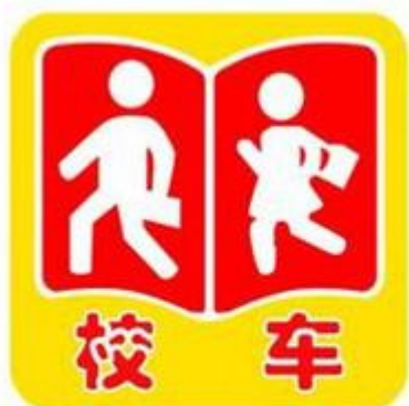
图4a) 校车标牌正面式样